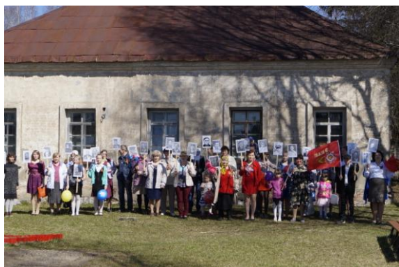
Митинг 9-го мая