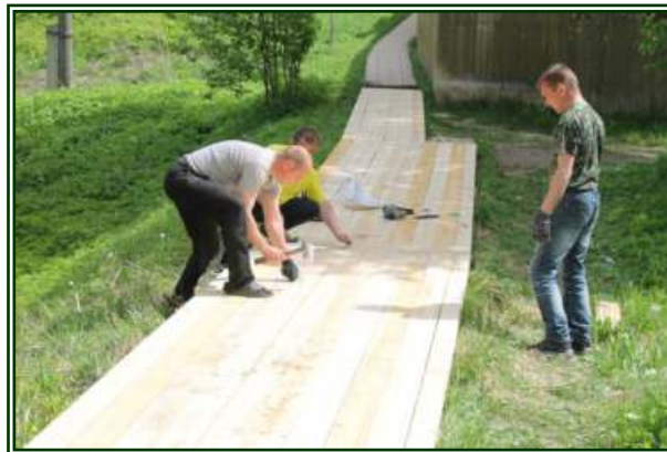
Пешеходный мостик к д/с «Сказка»