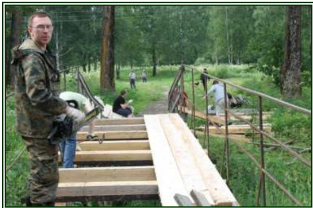
Пешеходный мост через р. Песья-Деньга