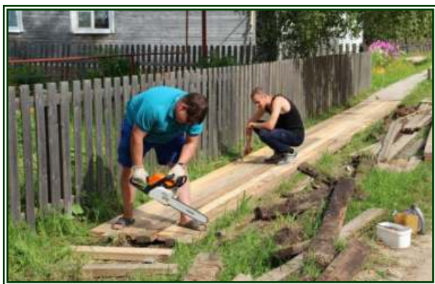
Мостки на ул. Урицкого к д/с «Солнышко»