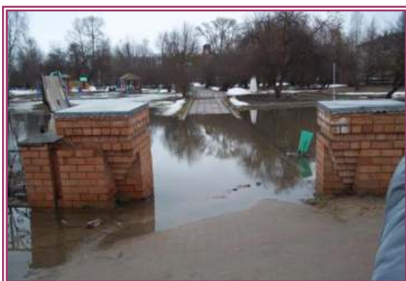
Вид сквера до реализации проекта: