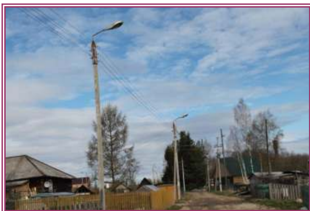
Устаревшие светильники в районе Лесотехникума с лампами ДРЛ-250