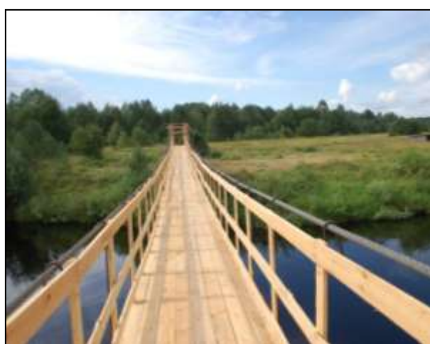
Новый подвесной мост в д. Герасимовская