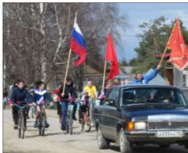
Велопробег по улицам села в честь Дня Победы.