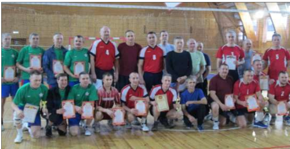
Команды участники соревнований по волейболу на приз СПК колхоз «Нишне-Кулое».

В спорткомплексе ежедневно проходят секции и соревнования по мини-футболу, волейболу, гимнастике, спортивно - развлекательные мероприятия. Спортивные мероприятия приурочены к государственным и народным праздникам (День Победы, День России, День народного единства, Масленица), ежегодно в феврале проходит Декада спорта.