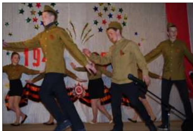
Танцевальные коллективы «Девчата» и «Пацаны», танец «На Берлин!».

Ежегодно летом проходит грандиозный праздник – «День села», торжественная часть которого посвящена определенному событию или юбилею. По традиции заканчивается этот день ретро-дискотекой под «живую» музыку с выступлением вокалистов нашего села. В 2017 году этот день был посвящен молодежи нашего села.