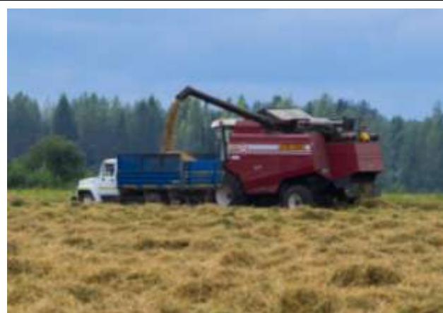
Уборка зерновых в дождливое лето 2017 года.

Проведена реконструкция телятника Дуравинской молочно-товарной фермы на 200 голов на сумму более 10 миллионов рублей. Приобретено 2 дома для работников предприятия. Ведется работа по строительству животноводческого комплекса на 685 голов крупного рогатого скота в д. Урусовская: приобретен земельный участок, утвержден градостроительный план, проведены геологические работы, составлена смета.