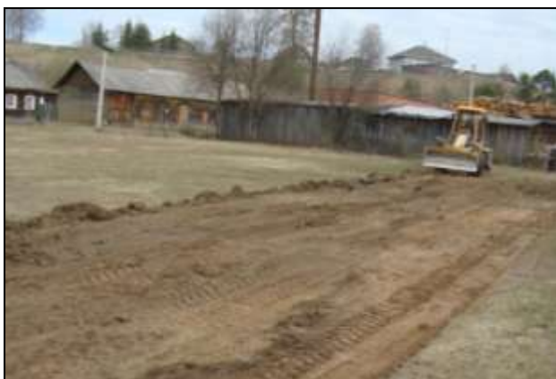
На поле работает специализированная техника

В весенне-летний период 2017 года проведены работы по выравниванию поверхности футбольного поля на школьном стадионе: снят дерн, проведено грейдирование, поле засеяно травой, сделана разметка.