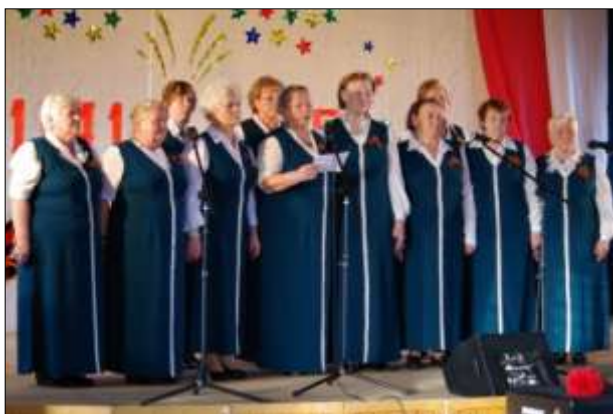
Выступление участников клуба «Ветеран» с песней «Юные курсанты».

Ежегодный большой праздничный концерт к 9 мая собирает около двухсот человек зрителей.