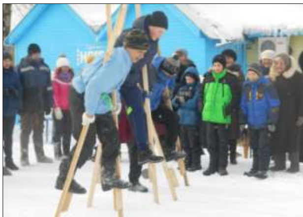
Спортивные забавы на «Масленице».