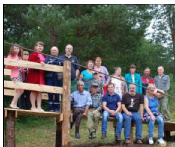
«Комиссия по приемке моста»

Логическое завершение получил проект 2016 года «Благоустройство родника в д. Урусовская». 16 июля 2017 года в храме Покрова Пресвятой Богородицы отслужена литургия, после которой прихожане прошли крестным ходом к роднику.