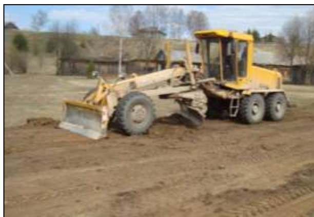
Грейдирование поверхности футбольного поля