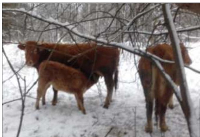
«Лимузины» комфортно чувствуют себя на улице и зимой.

В 2017 году предприятием уплачено налогов и сборов более 5 миллионов рублей, арендной платы за пользование лесами – 1 миллион 850 тысяч рублей.