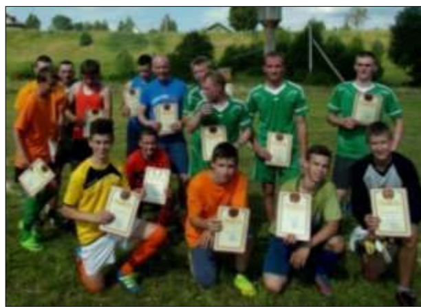
Соревнования по футболу в День села