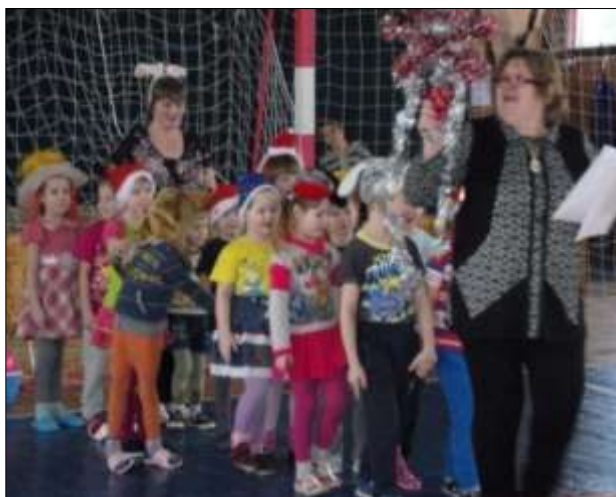
Игровая программа на святочных гуляниях с воспитанниками детского сада.

Традиционными и популярными среди населения стали соревнования по зимней рыбалке, «Зарница» для учащихся школы, велокросс по улицам села, соревнования по волейболу на приз СПК колхоз «Нижне-Кулое».