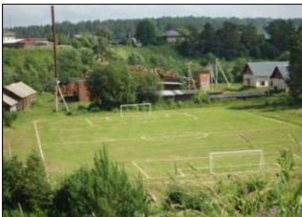
Все готово к футбольным баталиям