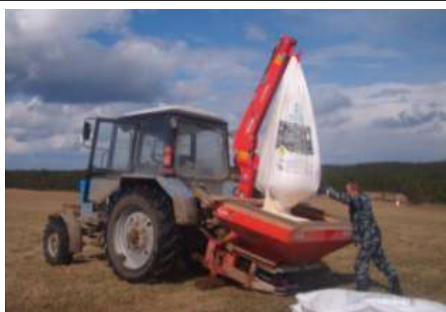
Идет загрузка минеральных удобрений в разбрасыватель.

В 2017 году приобретено основных средств на 11 миллионов рублей, в т.ч. трактор «Беларус-82» с прицепом, комплекс для заготовки сенажа в пленке стоимостью 7 миллионов 400 тысяч рублей.