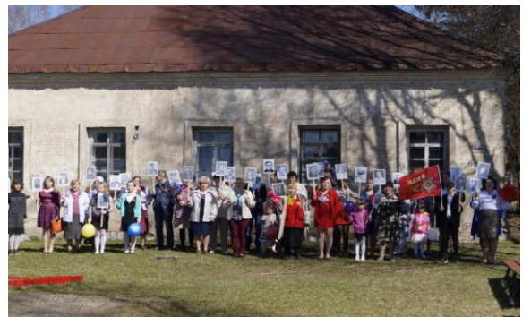
Митинг 9-го мая